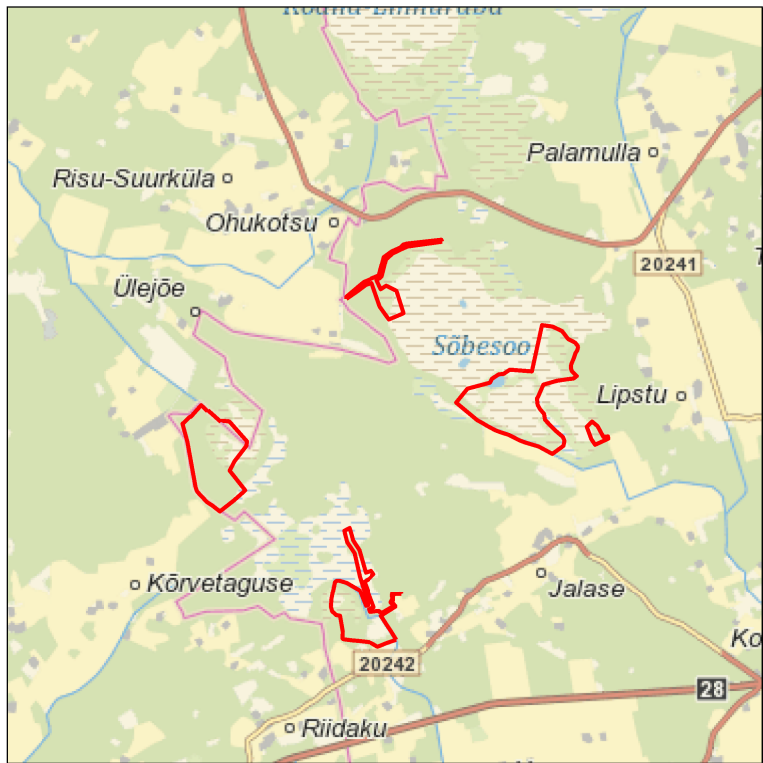
Kaardileht nr 631 Rapla